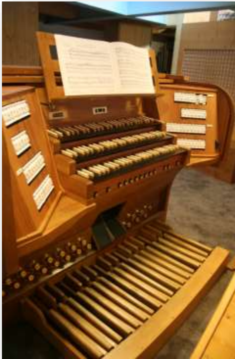
La consolle del grandioso organo Sattel-Sandri, dotato di 46 registri e circa 3500 canne

Le canne del Pedale “parlano” dalle cosiddette “Torri del Pedale”, poste dietro le canne maggiori di prospetto e da questa posizione (estrema ai lati dell’organo e avanzata sul piano del matroneo), mettono in risalto la funzione autonoma di questa sezione dell’organo come sostegno armonico, avvolgendo con la loro potente basseria tutto l’impianto sonoro e mettendo in risalto il “Cantus firmus”, nel caso che la melodia solistica sia affidata al pedale.