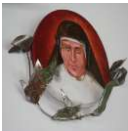
Santa Maria Domenica Mazza- rello Fondatrice delle "Figlie di Maria Ausiliatrice"