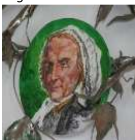
La Venerabile Margherita Occhiena la mamma di Don Bosco