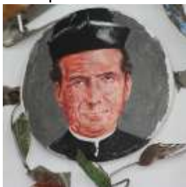
San Giovanni Bosco Fondatore dei "Salesiani"

braccio Gesù Bambino benedicente e con nella mano destra la sfera del Mondo universale. I tralci, che si protendono da Maria, particolarmente verso l'altare, entro medaglioni dipinti presentano i frutti più belli di questa mirabile pianta: