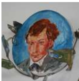
San Domenico Savio giovinetto protettore degli adole- scenti